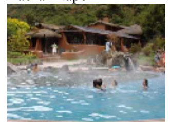
Papallacta Aguas termales