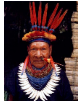
Un Indio nativo.